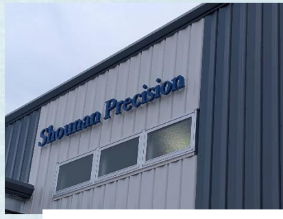
マシンセンター・ハイテクセンター