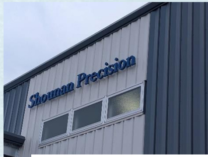
マシンセンター・ハイテクセンター