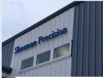
マシンセンター・ハイテクセンター